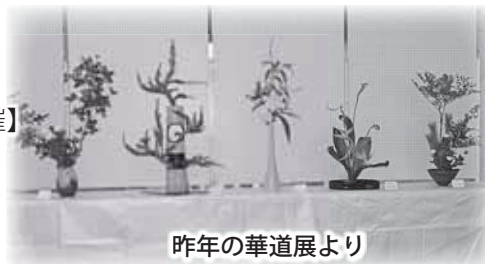
昨年の華道展より

■文学祭日時 平成30年12月15日(土) 午後1時から ■内容 入選作品の表彰式及び分科会【諸流華道展 前日(14日)より同時開催】 ■会場 小諸市文化センター(乙女湖公園内)