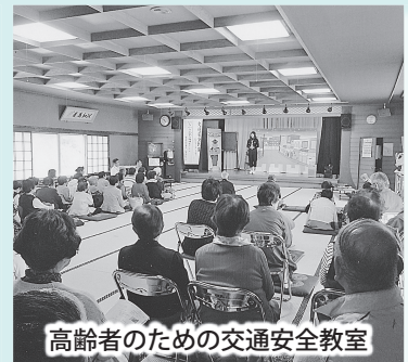
高齢者のための交通安全教室

が作成したもので、近年石倉家から小諸市に寄贈されたものです。この詳細に記録された絵図面をもとに、かつての小諸城の姿がCGで復元されます。私の所属する(一社)小諸フィルムコミッションが直接関係していることから、補足に説明をいたしました。全部の講座の内容を紹介したいところですが、紙面の関係で省略させていただきます。