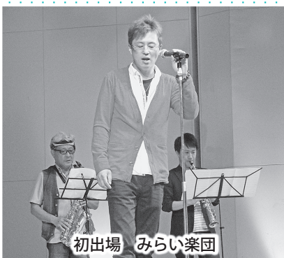
初出場 みらい楽団