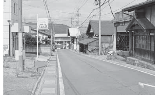
▲市町線（旧小諸本陣周辺）の状況

市は、旧小諸本陣（国重要文化財）の改修計画を実施するため、都市計画道路の市町線（本町交差点～懐古園入口交差点）を廃止する都市計画変更を進めています。