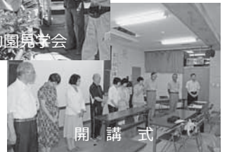
開 講 式

るのをお待ちしております。確かな情報を得て幅広い教養を培って正しい判断力で生きる糧として、地域の自治にも意識を高めましょう。