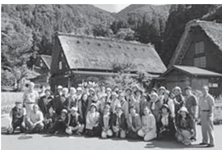
秋の研修旅行『飛騨・越中の旅』 白川郷にて