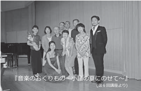
『音楽のおくりもの～小諸の夏にのせて～』 (第6回講座より)

小諸市民大学は発足から37年になり、これまでに受講者は4000名を超え、講師の方も述べ400名を数えます。毎年7月から9月まで10回開催しており、講師の選定から始まり全て市民による自主的な運営です。最新の時事問題から自然科学、社会科学、人文分野、健康医療問題また身近な地域に関わるテーマなどバラエティでバランス良くテーマを選定しております。毎年、小諸高等学校出身者による音楽コンサートも小諸高等