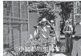
小諸動物園見学会