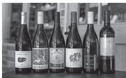
ふるさと納税返礼品の一例

本市における令和3年度のふるさと納税実績は、初の4億円を超えるご寄附をいただいた。収支バランスについては、寄附額の50%が純粋な実入りとして残るので、担当する職員の人件費を差し引いたとしても、財源確保の観点から大変意義のある事業だと考えている。