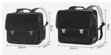
合成皮やナイロン製があり、色も選べる。