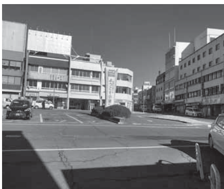
玄関口・小諸駅前をもっと素敵にできないか

商工会議所での取組みもあるが、引き続き「小諸の土産」づくりの取組みを支援していく。ぜひ、アイデアを出してほしい。