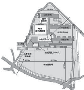
プールやテニスコートのない学校の配置図案

小諸市の子どもたちの教育に差があってはならないことである。令和10年度の統合に向け、教員による再編統合に向けた新たな検討組織を立ち上げることとなった。その検討組織の中で小中一貫したカリキュラム編成、カリキュラムマネジメントの実践方法、ICT、オンライン活用の可能性等についても研究し、子どもを育てるための教育理念を教育委員会、教員が共有することで、施設形態に捉われず、どこの学校でも同じ教育が受けられるよう検討を進めていきたい。