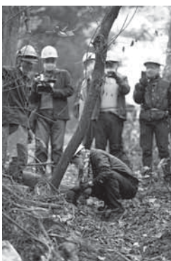
企業との森林づくり

森林（もり）の里親促進事業を通して、企業4社と2団体が里親として貢献いただいている。