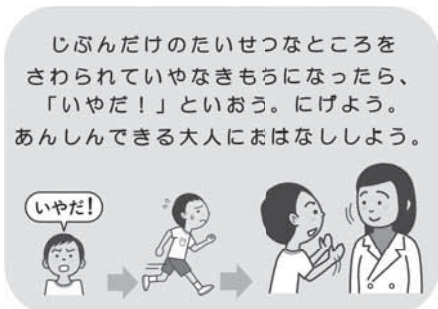
性暴力の加害者、被害者、傍観者にならない

子どもたちが性暴力の加害者、被害者、傍観者にならないよう、令和5年度から全国の学校にて「生命の安全教育」を推進することとなっている。1人1台端末で指導にに応じた教材が活用でき、充実を図りたい。家庭等の学習も含め効果的、効率的な学習の実施に取り組んでいきたい。