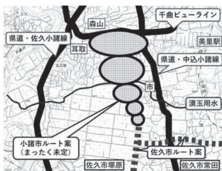
佐久平駅アクセス道路ルートイメージ

全て発注済みであり、今年度完了を予定しているが、全ての調査が完了する時期は明言できない。早期に完了できるように努めたい。