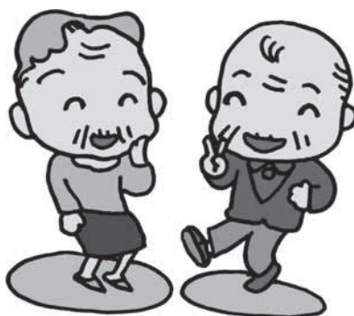
健康寿命の延伸と暮らしやすいまちづくりを