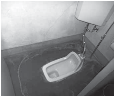
小中学校の環境整備を早急に！

全国で発達障害の可能性のある特別な教育的支援が必要な児童生徒が10年前の6・5%から8・