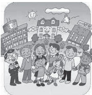
協働するまちづくり

本年度は、若年層の回答率が非常に低いということで、インターネットで回答ができるように工夫を行い、多くの皆様の回答内容や意見を施策に反映できるように取り組んでいきたいと考えている。