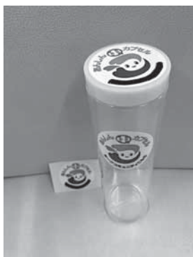
冷蔵庫で保管する「安心カプセル」

保育料は年間7千500万円を負担いただいております。現状では難しいが、国・県へ無償化に向けて働きかけをしていく。