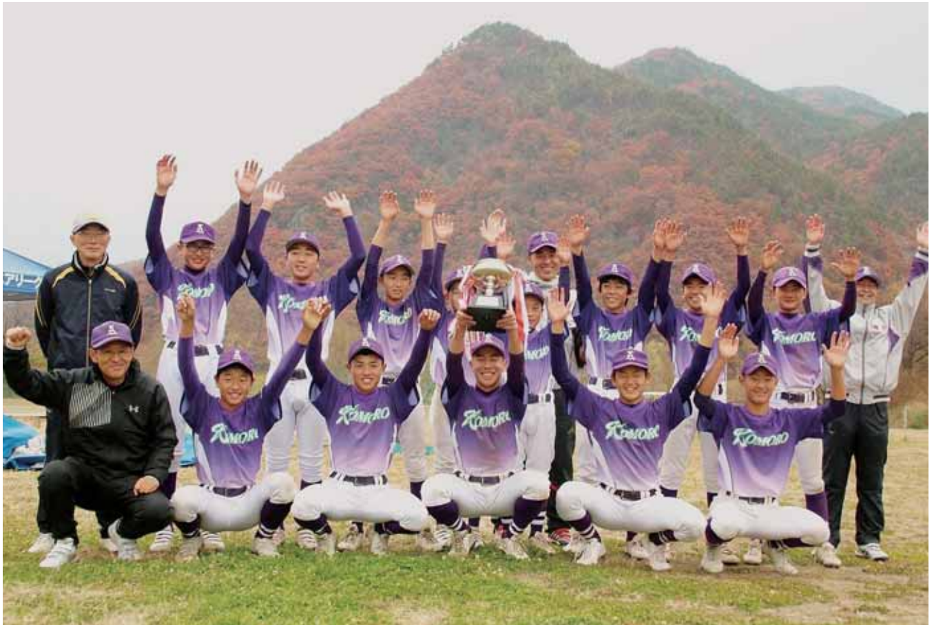
小諸リトルシニアの皆さん（16頁ぼいすをご覧ください）