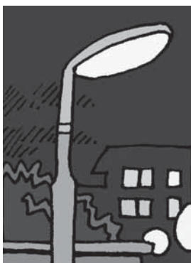
停電時も点灯する照明を要所に！

市町村によって在宅療養者数のばらつきや、機器の種類やメーカーも多様で専門性が高いことから、県による広域的な補助制度の創設が現実的と考える。非常用電源のニーズや他市の状況を研究し、県市長会などを通して働きかけたい。