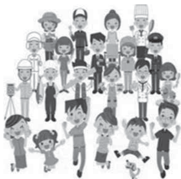
夢・希望のまちづくり

商工業振興の観点では、都市機能として欠かせない大型店の定着を図りつつも、まずは北国街道沿いをはじめとする市街地を中心に、歴史的遺産や古い街並みを活かしながら、既存業者と新たな事業者の連携を生み出していききたいと思う。そして、そこから発信される古くて新しい街の姿が、ほかの地域との差別化につながり、消費者には、「小諸らしさ」として認知されていくと考えている。そのため、飲食・小売り・サービス業などを中心に、特色ある店舗の誘致を進めていきたい。