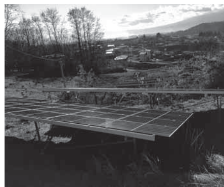
課題のある太陽光発電設備

基準に合致していない案件は文書口頭にて指導依頼をしているが違反案件については、住民に理解されていない為に、合意形成が図られるよう指導を実施していく。