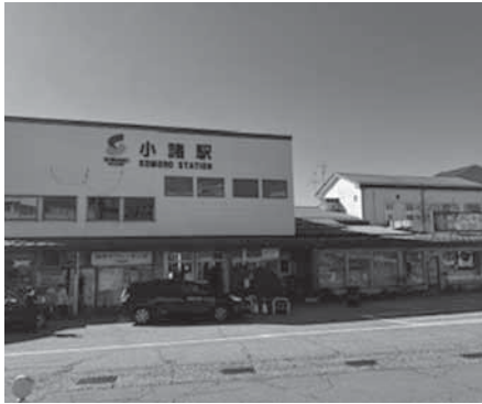
小諸の玄関口「小諸駅舎」