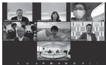
茨城県取手市議会をオンラインで視察

会議開催のために、議員各位がタブレットの貸与を受けることへのきっかけともなりました。