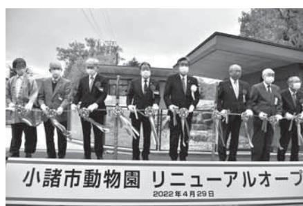
小諸市動物園 リニューアルオープン 2022年4月29日

要ですが、議会活動によって市民の皆様が一刻も早く安心・安全に暮らせるように第19次議会へバトンを渡したいと思えます。