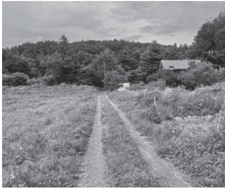
実効性ある条例制定で地域の環境を守ろう