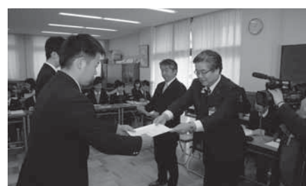
小諸商業高校で審査結果通知書を手交