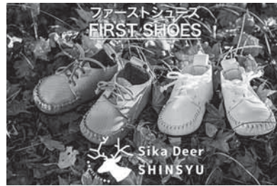
ファーストシューズ

スキットル、職員も使用しているネームケース、IDカードフォルダー、子供が出生した際の記念になるファーストシューズなど13個を追加した。