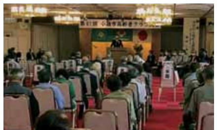
高齢者クラブ大会