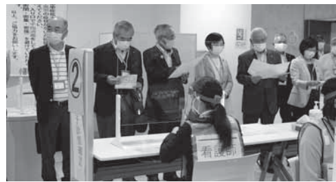
ワクチン接種会場のシミュレーションに参加

市政においては、複合型中心拠点誘導施設「こもテラス」が8月に公共施設棟が、10月には商業施設棟がオープンしました。