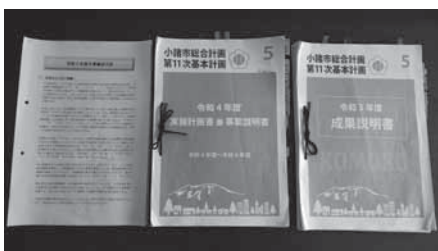
小諸市総合計画関係書類

施策1の子育て・教育分野は、人づくりであり、小諸の将来をつくる最重要政策で、希望に繋がる子どもが生きやすいまちは高齢者も障がい者にも優しく、誰にとっても生きやすいまちだ。この分野