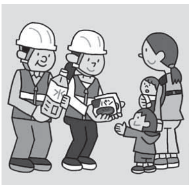
地域に寄り添った防災対策を進めよ。

小・中学校への備蓄コンテナの設置は、有事の際、夜間や休日におけるスムーズな利用が可能となる。地域と学校双方の防災体制の強化につなげたいと考えるので、優先する箇所から検討する。