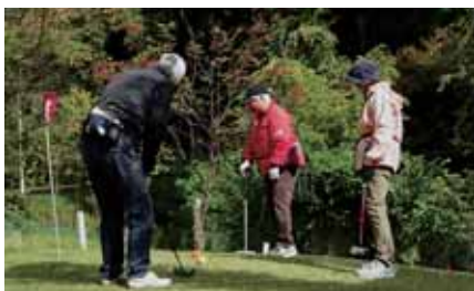
マレットゴルフ大会

ンター「こもれび」が活動拠点と事務局です。クラブ設立などお気軽にご相談ください。また、高齢者施設となっておりますので、お出かけください。