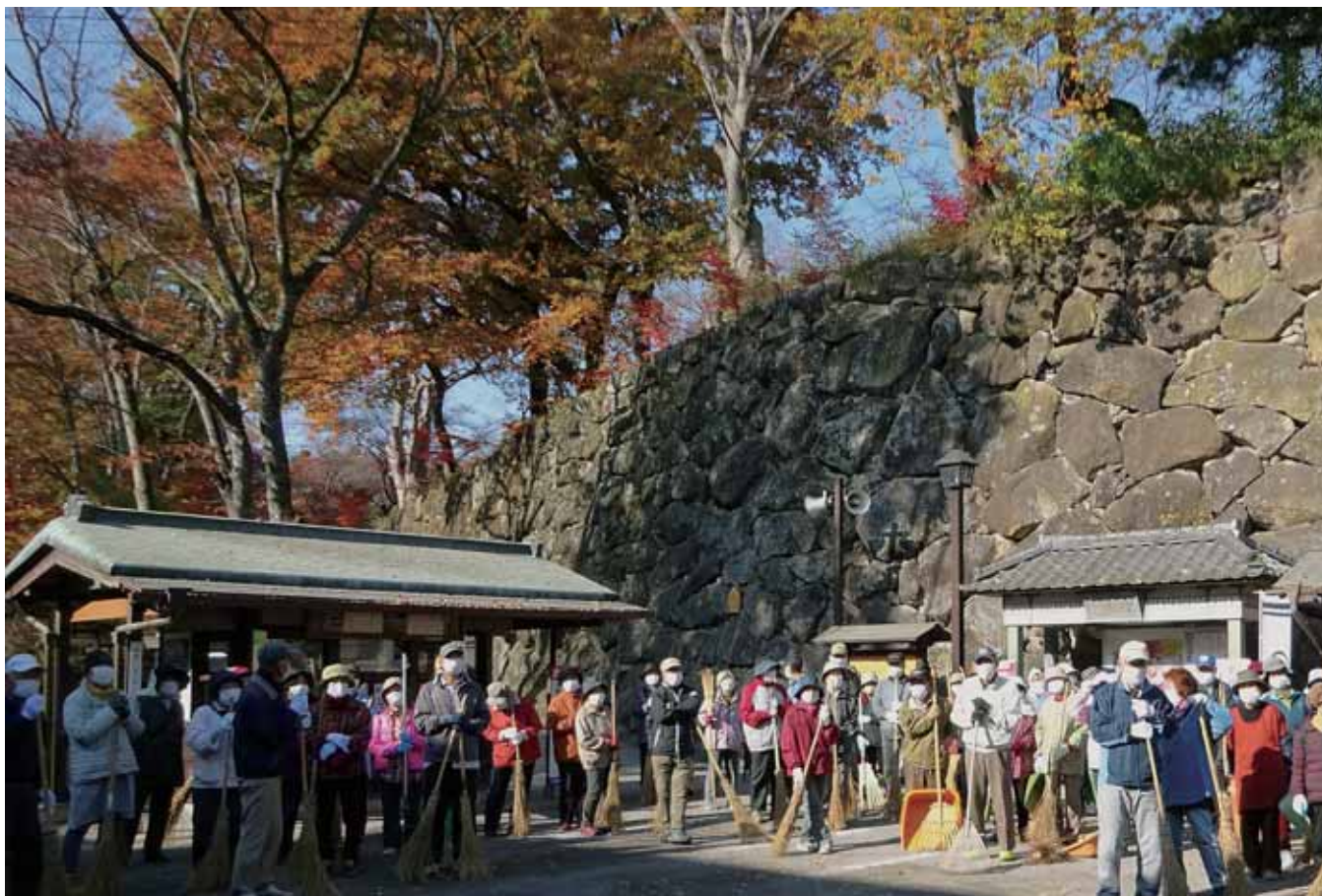
小諸市高齢者クラブ連合会の皆さん（社会奉仕活動の懐古園清掃）