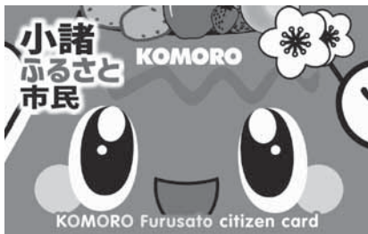
小諸ふるさと市民カード

答 区の事務手数料は月に2回の文書配布手数料で、1世帯につき年間900円で計算している。区長事務手数料は区の世帯数に応じての支払いで、例えば49戸以下の区は年間13万8千円、