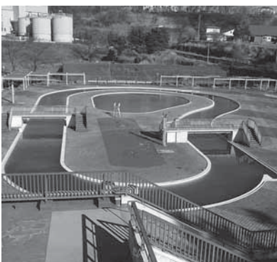
解体後、駐車場となる予定の南城流水プール

民間企業で、公園の魅力向上の公募に応募してくれるところがあり、それがいい事業計画であれば採用したいし、あらゆる可能性を探っていきたい。