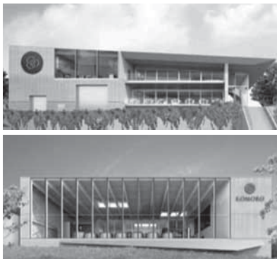
スタラス小諸(上) & 小諸蒸留所(下)

スタラス小諸（ワイナリー）と小諸蒸留所（ウイスキー）が来春開業するが展望はどうか。