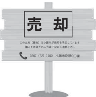
こんな立て看板で市民に広報したら?!

現在公募終了後立札等を撤去しているが、今後売却情報の広報の為、立て看板等を検討したい。