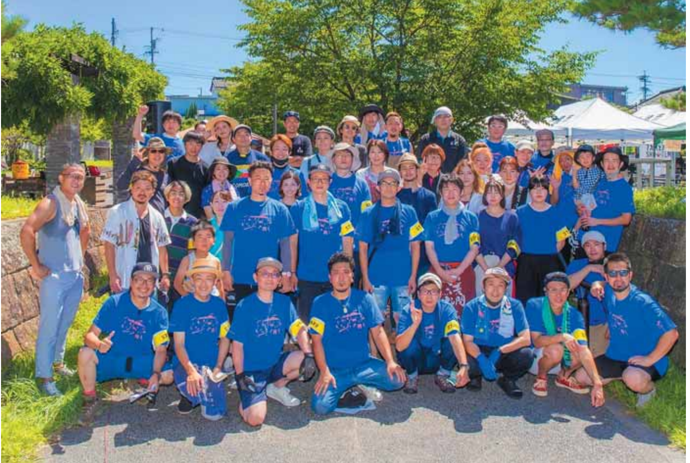
小諸商工会議所青年部の皆さん（小諸の食と職を未来に繋ぐ「こもミラにて」）