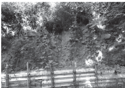
またれる土砂崩落復旧工事

各区、立地条件が異なる部分があるが、道路改良等の建設事業申請については、引き続き一つの区について3件程度で収めていただくようお願いをしている状況である。今後「防災・減災、国土強靱化のための5か年加速化対策」で、財政的に有利な起債等の財源確保が考えられることから、来年度以降、生活道路も含めた舗装の打ち替え工事等の部分も重点的に進めていけるように現在検討し、実施率の向上を図りたいと考えている。