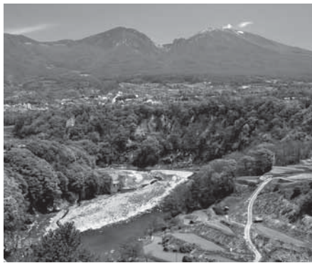
持続可能な小諸市であり続けるために