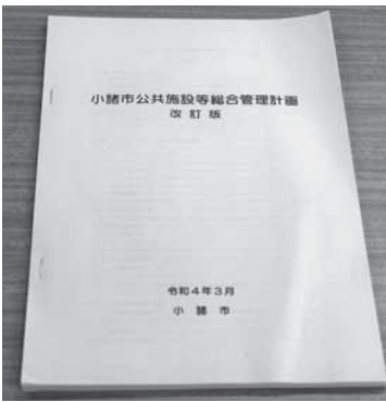
策定になった公共施設等総合管理計画改定版

あり方等を検証して実行していくので、地域づくりの大きな視点を意識したものになると考える。