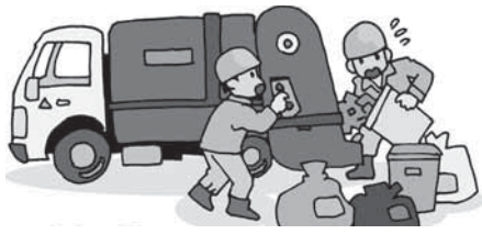
ごみ問題から環境を考える

早速、区長会の役員会にも伝え、各区の事情や地域性、規模なども考慮しながら検討していきたい。