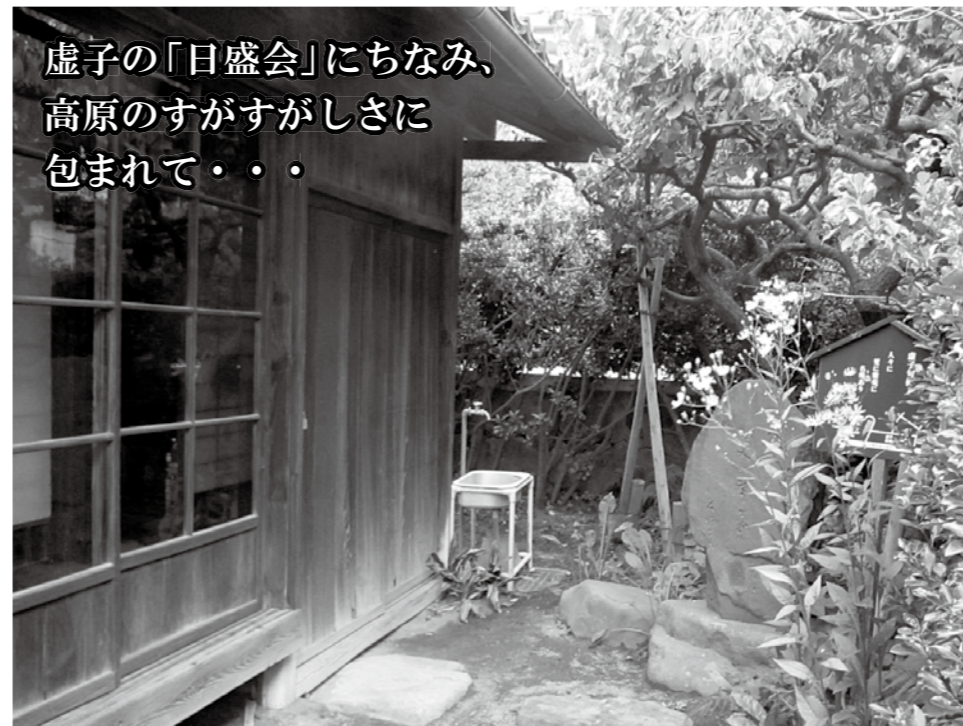
虚子の「日盛会」にちなみ、 高原のすがすがしさに 包まれて・・・