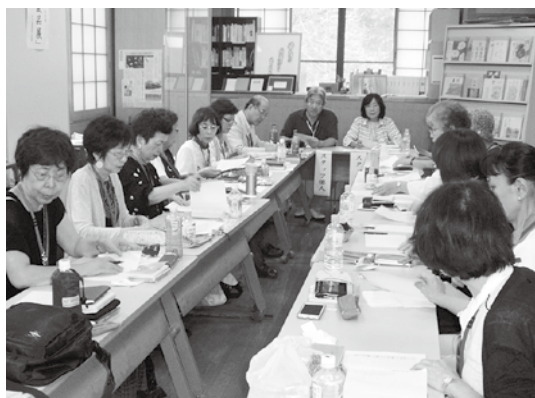
第9回 虚子記念館句会 スタッフ俳人とともに

特選 第9回 記念募集句(2日目) 伊藤伊那男 選 丘の墓直立不動にて灼くる 奥坂まや