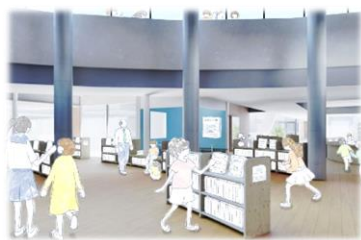
学びの街角(交流広場) ☞ 1階昇降口前スペース