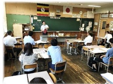
正副委員長会の様子