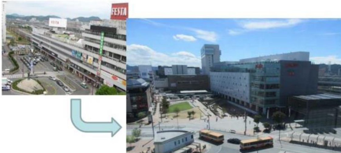
車中心の駅前広場空間を人が交流するおもてなし広場へと転換