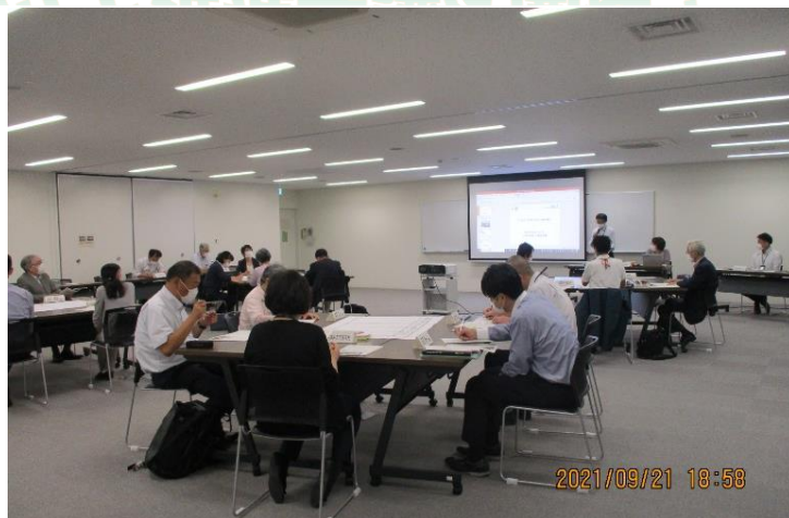
▲新型コロナウイルス感染拡大の影響で中止・延期を経て、今年度第1回目の推進会議を開催することができました。

それぞれのテーマについて、実態把握・検証、地域でのワークショップを進め、次回以降の地域ケア推進会議で協議を進める予定です。