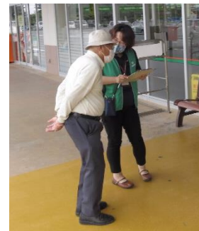
▲市内スーパーでの聞き取りでは、買い物の合間に快く調査に応じていただきました。