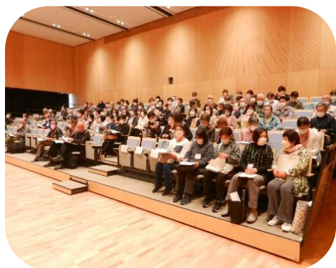
小林教育相談員の話を受講する参加者