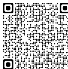
厚生労働省 HP 「教育訓練給付制度」