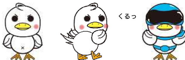
小諸市ごみ減量キャラクター 減ちゃん

減ちゃんは、環境のよい小諸市を守るため誕生しました。パトロールでは変身もします。