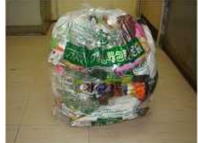
プラスチック製容器のリサイクル