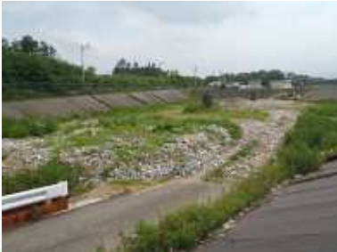
埋立処理場（御影区）

資源や処理施設を大切に使い、経費を節約するためには、分別も大切ですが、ごみを減らしていくことが、最も大切です。