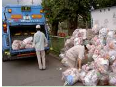
燃やすごみの処理費用