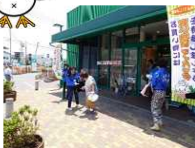
レジ袋削減啓発活動