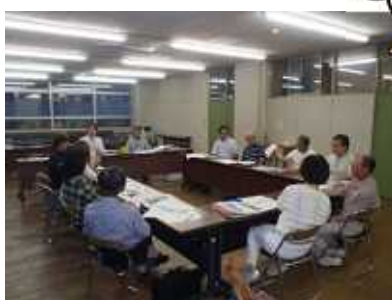
アドバイザー会議