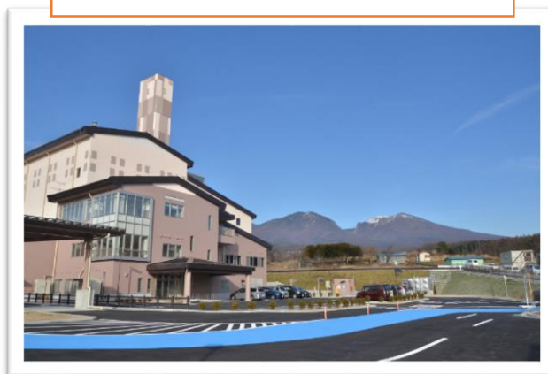
ごみ焼却施設 クリーンヒルこもろ

分かりづらい分別品目について、「広報こもろ」に毎号掲載して周知を行っています。また、ごみ資源収集カレンダーを全戸配布し、別荘地や集合住宅の集積所にも設置するなど、排出ルールの一層の徹底を図っており、悪質な違反排出者等へは直接指導を行っています。