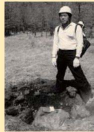
昭和58(1983)年4月8日の噴火で火口から飛来した直径約70cmの噴石。火口から約2kmの湯の平にて。