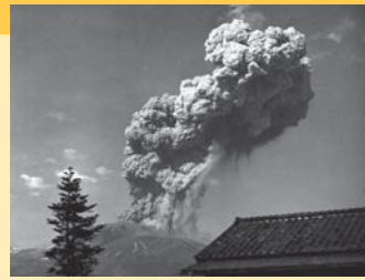
昭和33(1958)年12月14日の噴火による噴煙の様子

噴火した場合、火口から4km以内では、50cm程度までの大きな噴石(岩塊)が飛んでくる可能性があります。明治時代以降の噴火で犠牲になった方々は、全て火口から4km以内にいた登山者で、噴石(岩塊)の直撃を受けて亡くなっています。